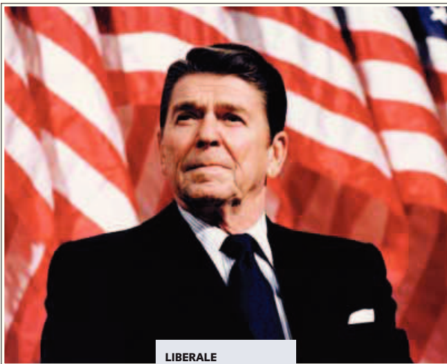
LIBERALE Nella foto, Ronald Reagan (1911-2004), presidente degli Stati Uniti tra il 1981 e il 1989